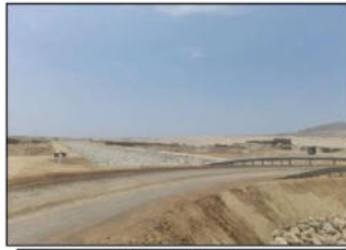
Vista del Predio