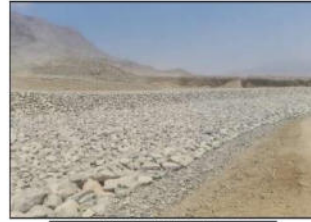
Vista del Predio