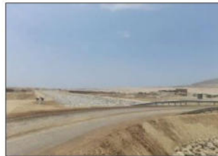
Vista del Predio