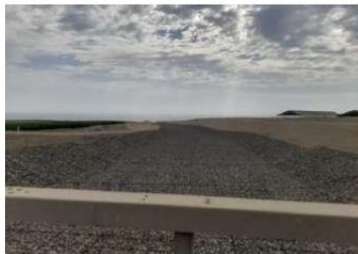
Vista del Predio