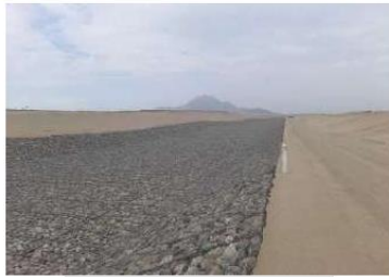
Vista del Predio