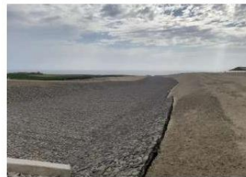
Vista del Predio