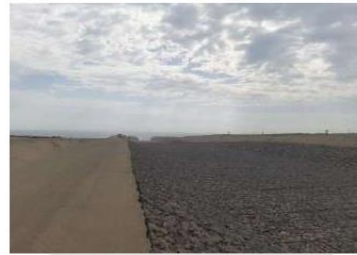
Vista del Predio