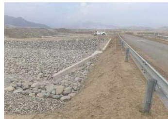
Vista del Predio