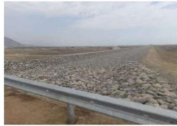
Vista del Predio