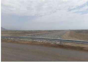
Vista del Predio