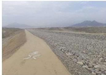
Vista del Predio