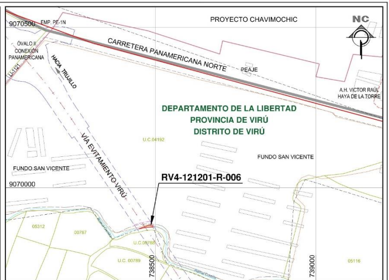
PLANO DE UBICACIÓN ESCALA : 1/7,500

ACOGIMIENTO AL REGLAMENTO DE INSCRIPCIÓN DEL REGISTRO DE PREDIOS DISPOSICIONES COMPLEMENTARIAS Y FINALES CUARTA: Supuesto excepcional de independización. Tratándose de independización de predios en los que no sea factible determinar el área, los linderos o medidas perimétricas del predio remanente, no se requerirá el plano de este: En estos casos bastará con presentar el plano del área materia de independización visado por la autoridad competente, previa suscripción por el verificador cuando corresponda.