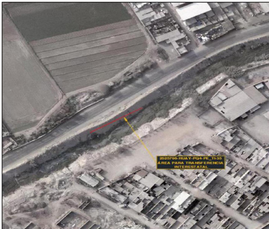
Imagen 01 – polígono del área a transferir