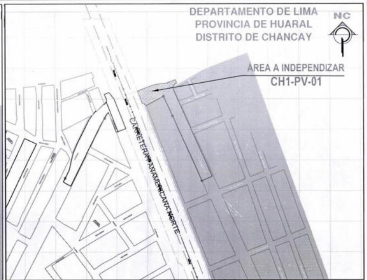
PLANO DE UBICACIÓN ESCALA : 1/5000

PREDIO AFECTADO POR EL PROYECTO RED VIAL N°5