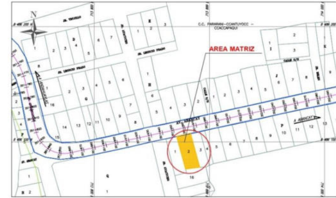
PLANO DE UBICACION ESCALA 1:2,000