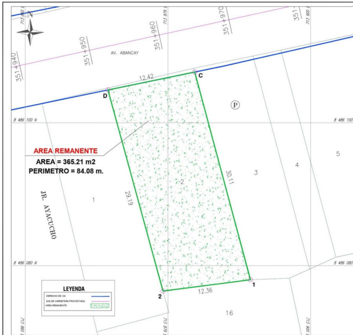
PLANO PERIMETRICO ESCALA: 1/ 200