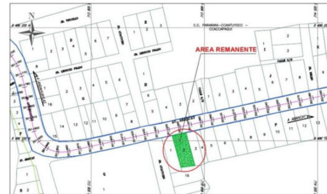
PLANO DE UBICACION ESCALA 1:2,000