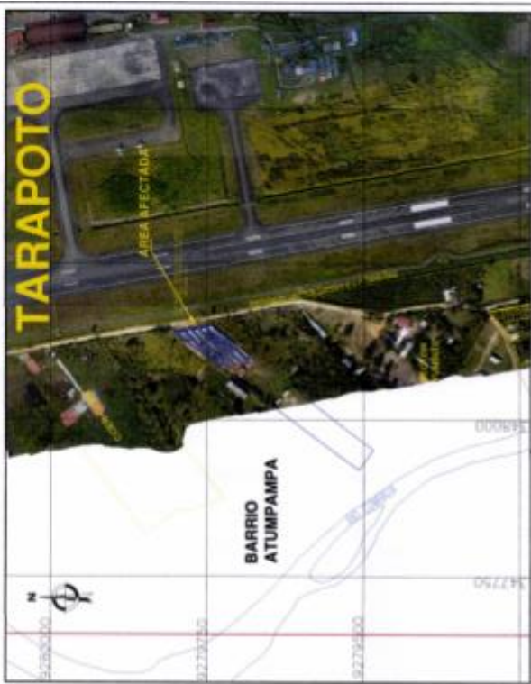
PLANO DE UBICACIÓN ESCALA 1/ 5000