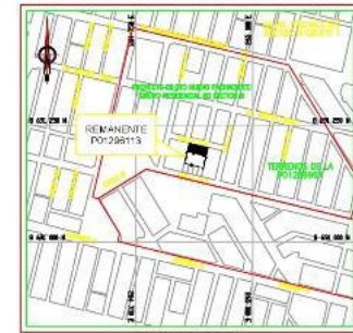
PLANO DE UBICACION ESC:1/10,000