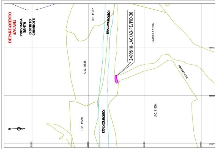
PLANO DE UBICACION ESCALA = 1/75,000