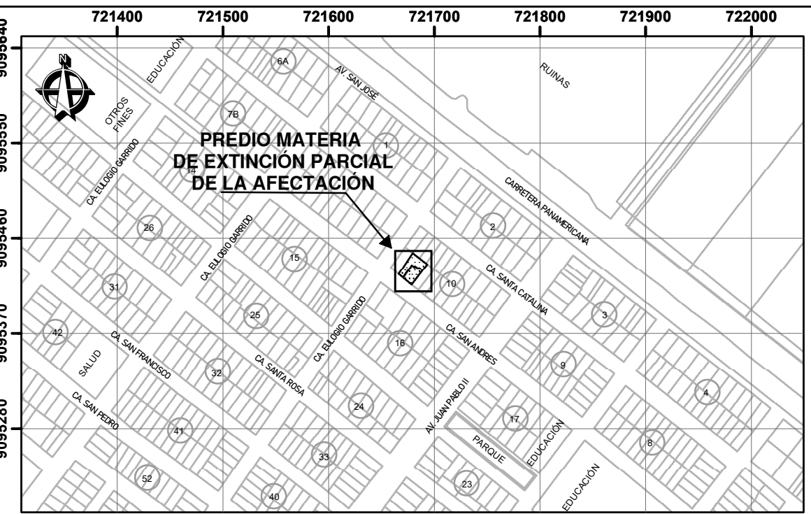
PLANO DE UBICACIÓN ESCALA 1:5,000