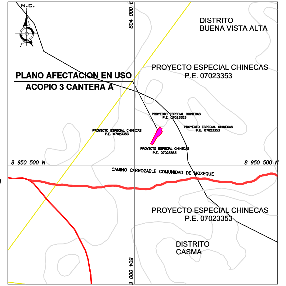
PLANO UBICACIÓN ESCALA: 1 / 25,000