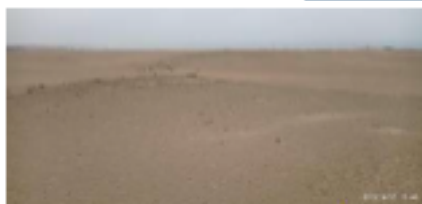
Vista del Predio