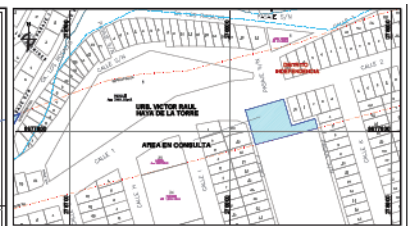
PLANO DE UBICACION ESCALA 1:10,000