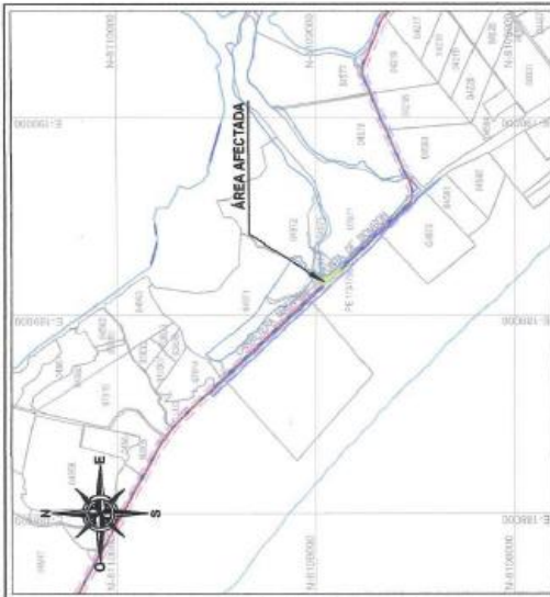
PLANO DE UBICACION ESCALA 1:25,000