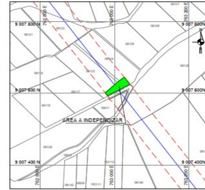
PLANO DE UBICACION ESCALA : 1/5000