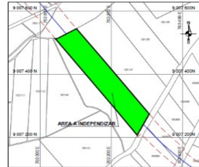
PLANO DE UBICACIÓN ESCALA : 1/5000