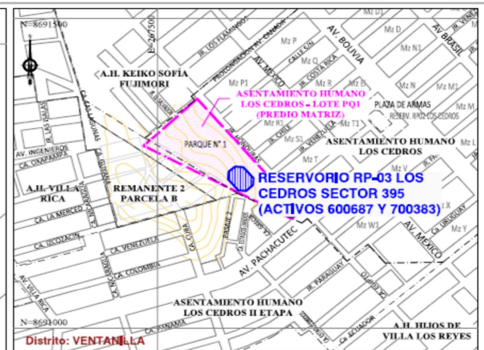
PLANO UBICACIÓN ESCALA: 1/5,000